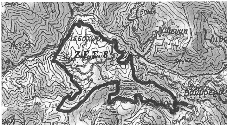
( Ζ.Ε.Σ. 8 ) Μεσοχώρας και Μοσχόφτου Δήμου Πύλης